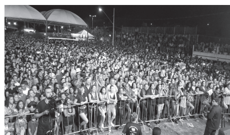
As quase 10 mil pessoas que usufruíram da inédita estrutura de segurança e organização além do conforto de arquibancadas, montada na Avenida Agripino Velasco de Castro na noite do dia 16, se divertiram com os shows de Hugo e Guilherme e depois com Bruno e Marrone