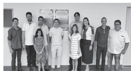
Inauguração das câmeras de segurança e vídeo monitoramento que colocará Perdizes em um patamar diferenciado no quesito segurança pública.