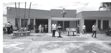
Autoridades e populares se reúnem para a inauguração da reforma do velório municipal e ampliação do cemitério.