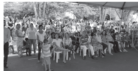
Após a missa, o tradicional bolo comemorativo na Praça Governador Valadares reuniu autoridades e população para cantar os parabéns aos 81 anos de Perdizes.