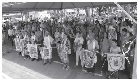
Encontro de Folias de Reis na praça Goernador Valadars onde reuniu foliões de Perdizes e de toda a região abrilhantando as festividades da comemoração dos 81 anos de Perdizes.