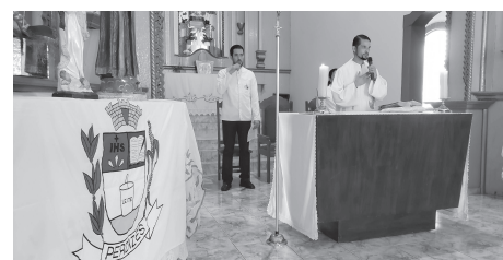
No dia 17 de dezembro, dia do aniversário de Perdizes, as comemorações começaram com a celebração de missa na Igreja Matriz de Nossa Senhora da Conceição.