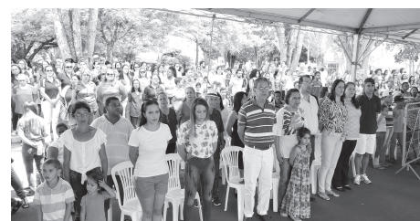
Prefeito e Primeira Dama fazem a partilha do bolo juntamente com diretores dos CMEIS e escolas municipais.