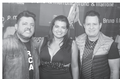
Fãs curtem seus ídolos nos camarins com Bruno e Marrone e Hugo e Guilherme, momentos que ficaram registrados para sempre na memória de cada um.